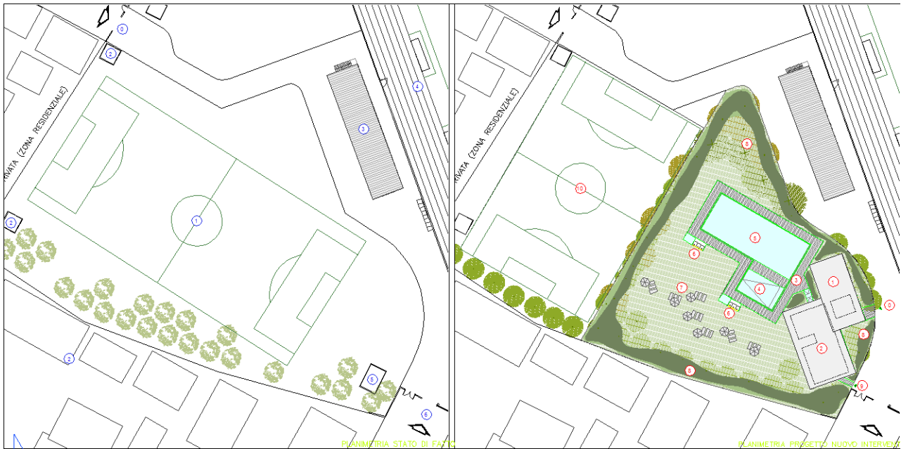
Fig.3–Planimetria confronto, frastato difatto e stato di progetto

In termini progettuali e di servizio alla comunità, si ritiene che la realizzazione di questo nuovo impianto possa segnare un deciso passo avanti sia per quello che riguarda l'offerta al pubblico sia per quello che riguarda gli aspetti gestionali dell'attuale centro sportivo comunale.