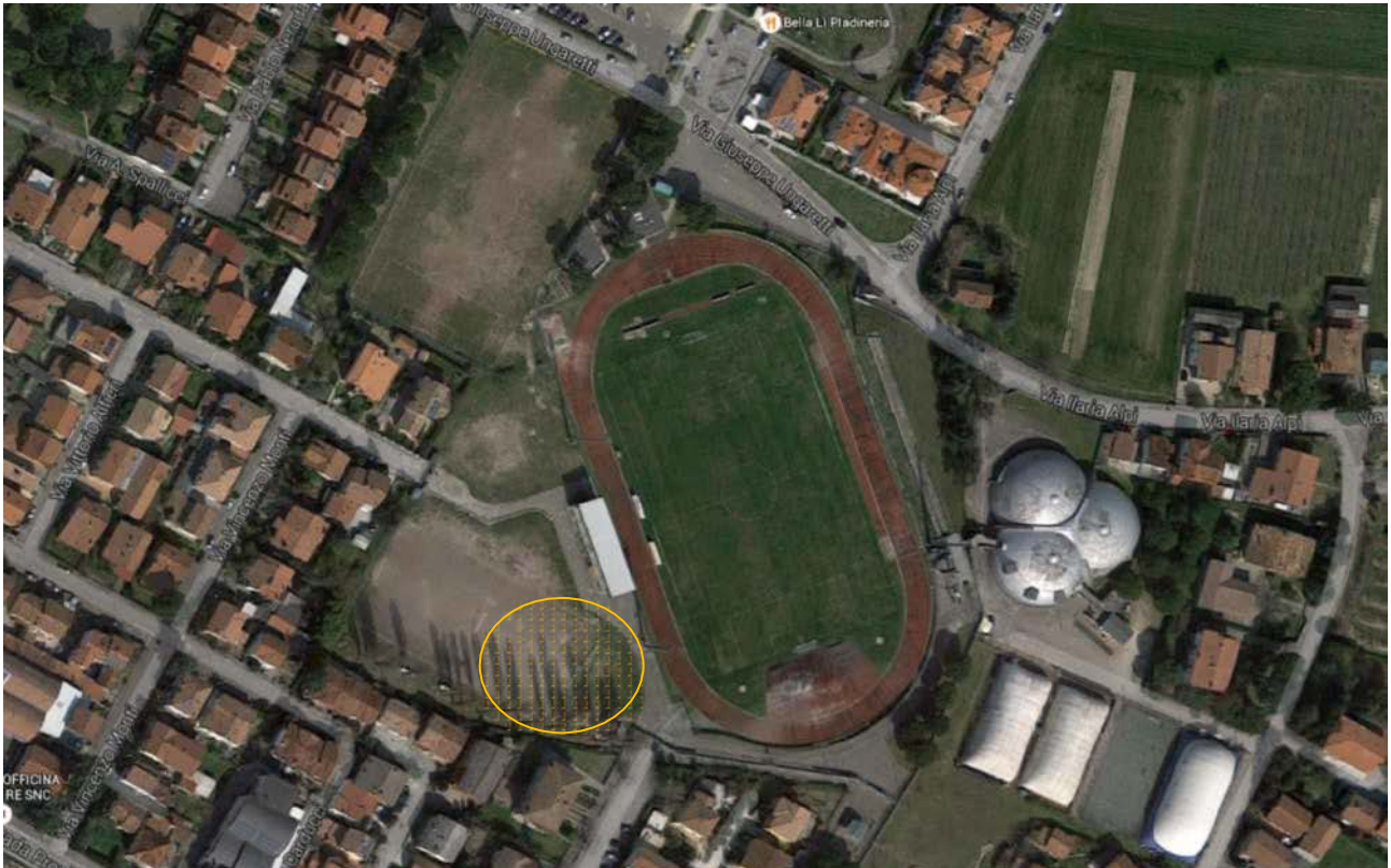
Fig.2–L'attuale polo sportivo

Rispetto al complessivo dell'attuale centro sportivo, la nuova struttura troverà posto a Sud-Ovest rispetto all'attuale pista di atletica e occuperà l'area dove ora si trova il campo di calcio da allenamento (dim. 36x75 m): dopo la realizzazione della piscina il campo verrà ripristinato nella stessa area, ruotato, spostato verso Ovest e ridotto di dimensioni (36x55 m).