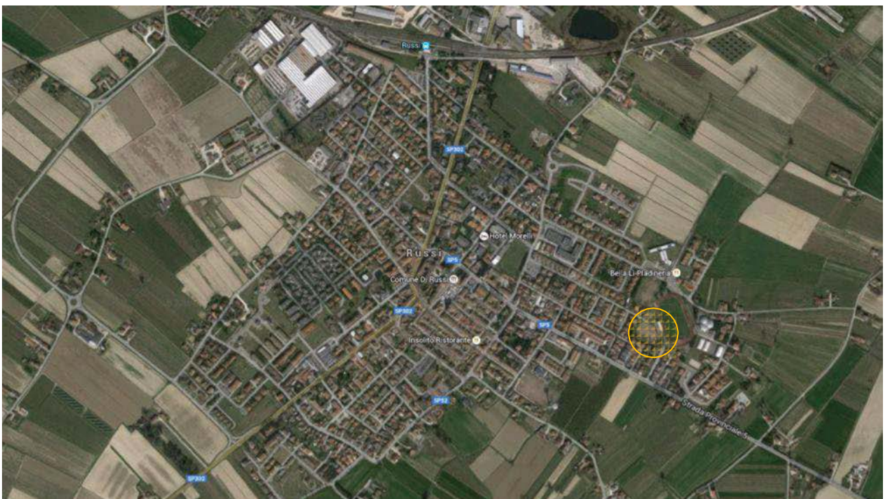
Fig.1–Localizzazioneambito di intervento

L'ubicazione degli interventi è riportata di seguito in fig. 1.